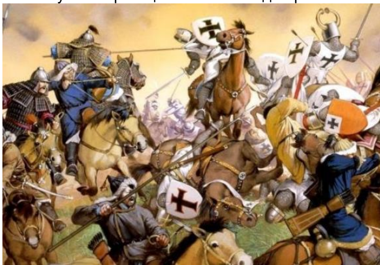
Рис. 2. Події Хрестового походу.

На наступній картинці ми бачимо події Хрестового походу (Рис. 2):