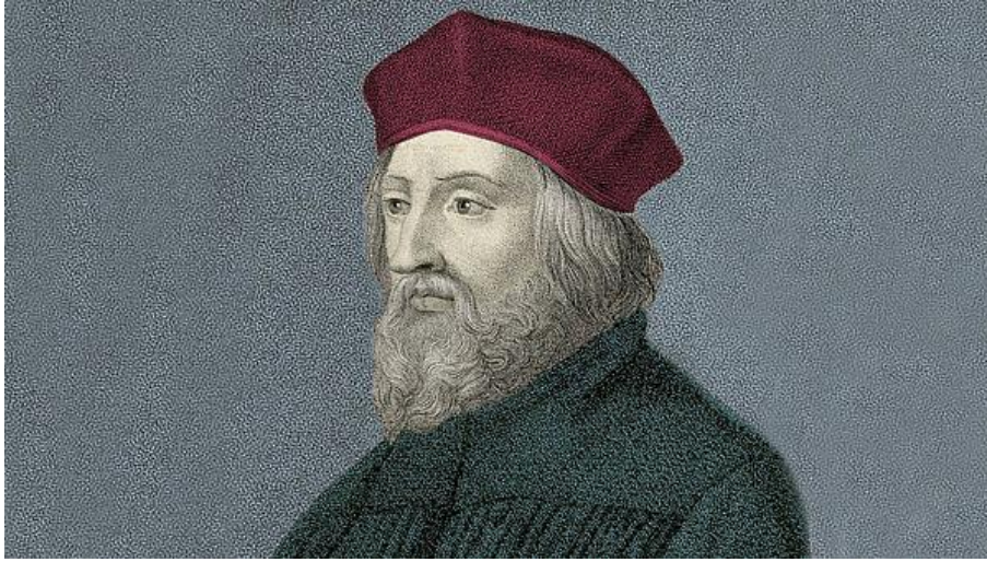
Рис. 3. Портрет Яна Гуса.

На цій картинці ми бачимо портрет Яна Гуса (Рис. 3):