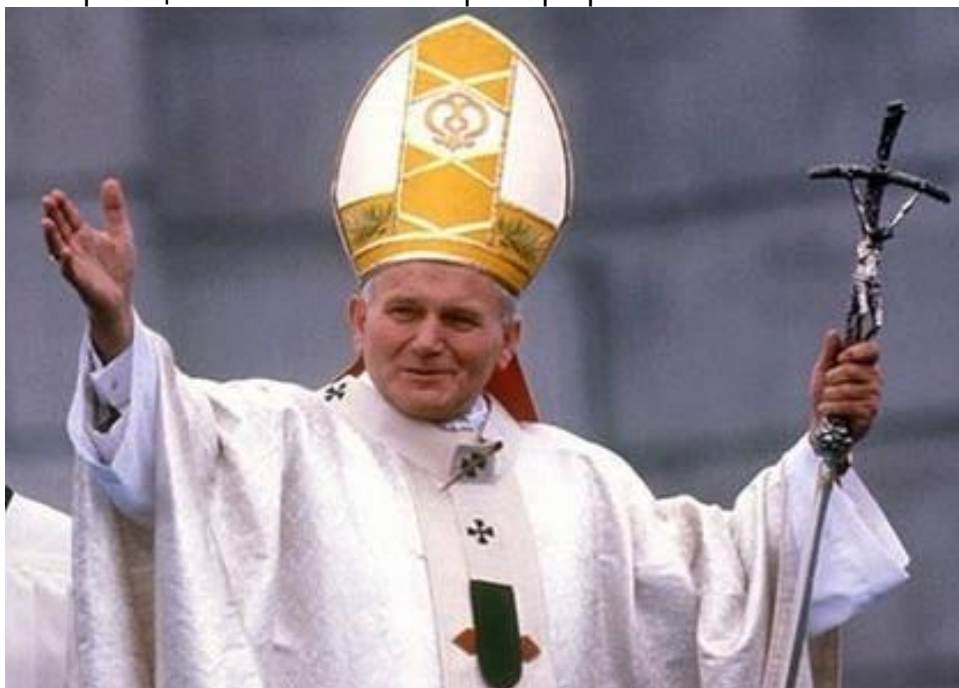
Рис. 5. Папа Римський Іван Павло II.

На картинці нижче ми бачимо фотографію Папи Римського Івана Павла II: