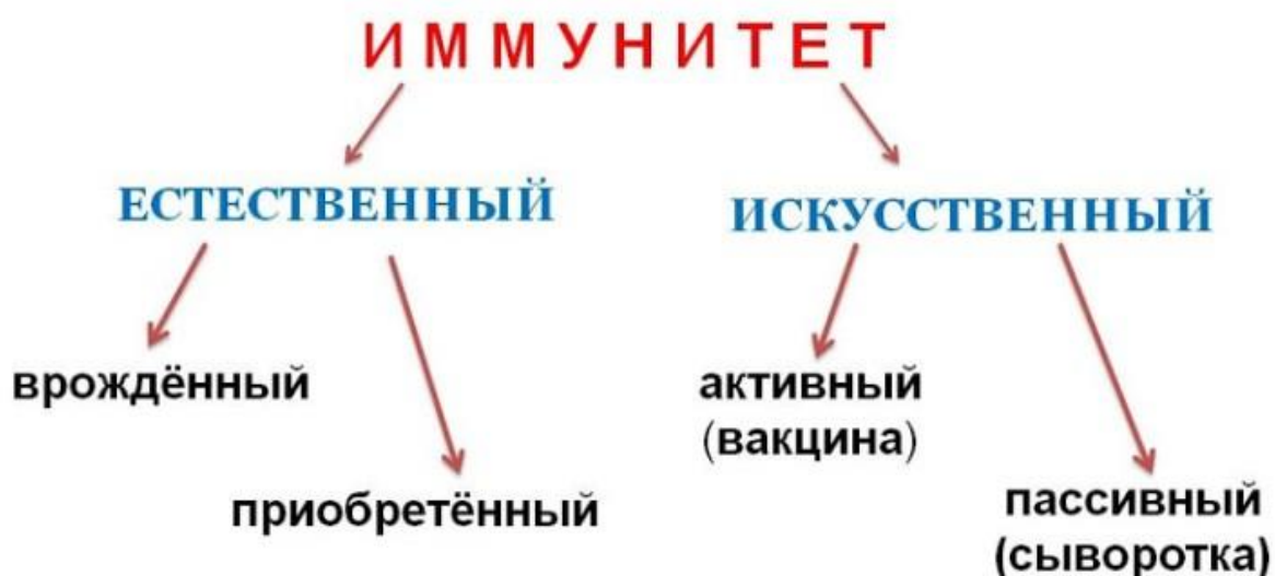
Рис. 2. Иммунитет

Если инфекции чаще происходят или имеют серьезный курс и склонность к повторению, необходимо провести диагностику иммунодефицита. Однако это трудно из-за распространенности инфекций у детей с нормальной иммунной системой (Рис. 2). (Лю и Lowther, 1992; Грунтенко, 1982).