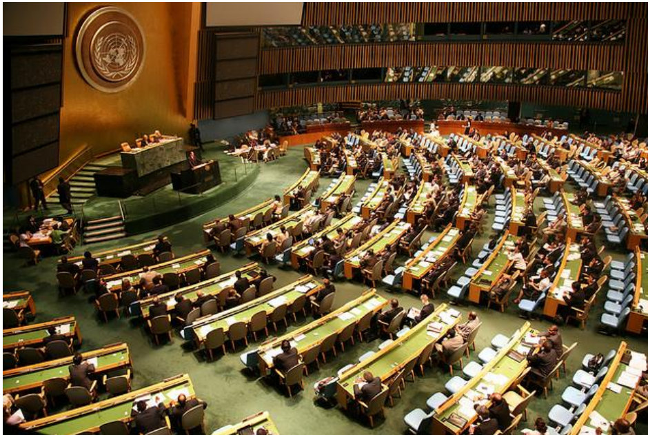
Рис. 3. Засідання Генеральної асамблеї ООН (Kantaria, 2014)

На наступній картинці ми бачимо засідання Генеральної асамблеї ООН (Рис. 3):